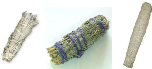
Rolos de fumo índio para defumação ( smudging )