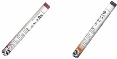
Incensos japoneses – Flor de cerejeira, Figo, ...