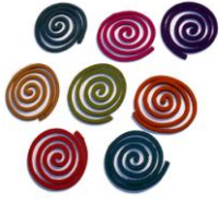
Incensos em espiral