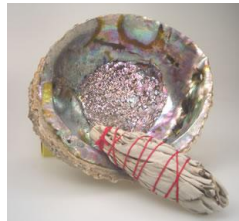
Conchas “abalone” para smudging , de 5 e de 6 polegadas e Tripés artesanais índios em madeira para as mesmas