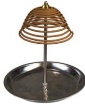
Suporte para espirais de incenso