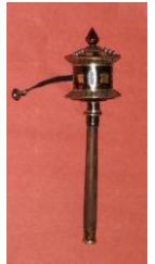
Rodas de Oração tibetanas – de mesa, de mão e de parede