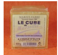
Sabões de Marselha – Óleo de oliva e Óleo de palma