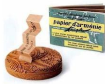
Papel da Arménia – o desodorizante de ambientes mais natural (à base de benjoim)