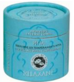
Cones de Medicina Aiuurvédica – Vata, Kapha e Pitta