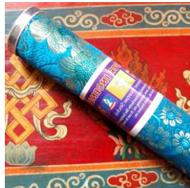
Incensos tibetanos e do Butão – Ribo Sangtsheo, Relaxence, Potala, Dharma, Zimbro, ...