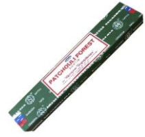
Incensos indiano – Patchouli Forrest, Midnight, Sunrise, Celestial, ...